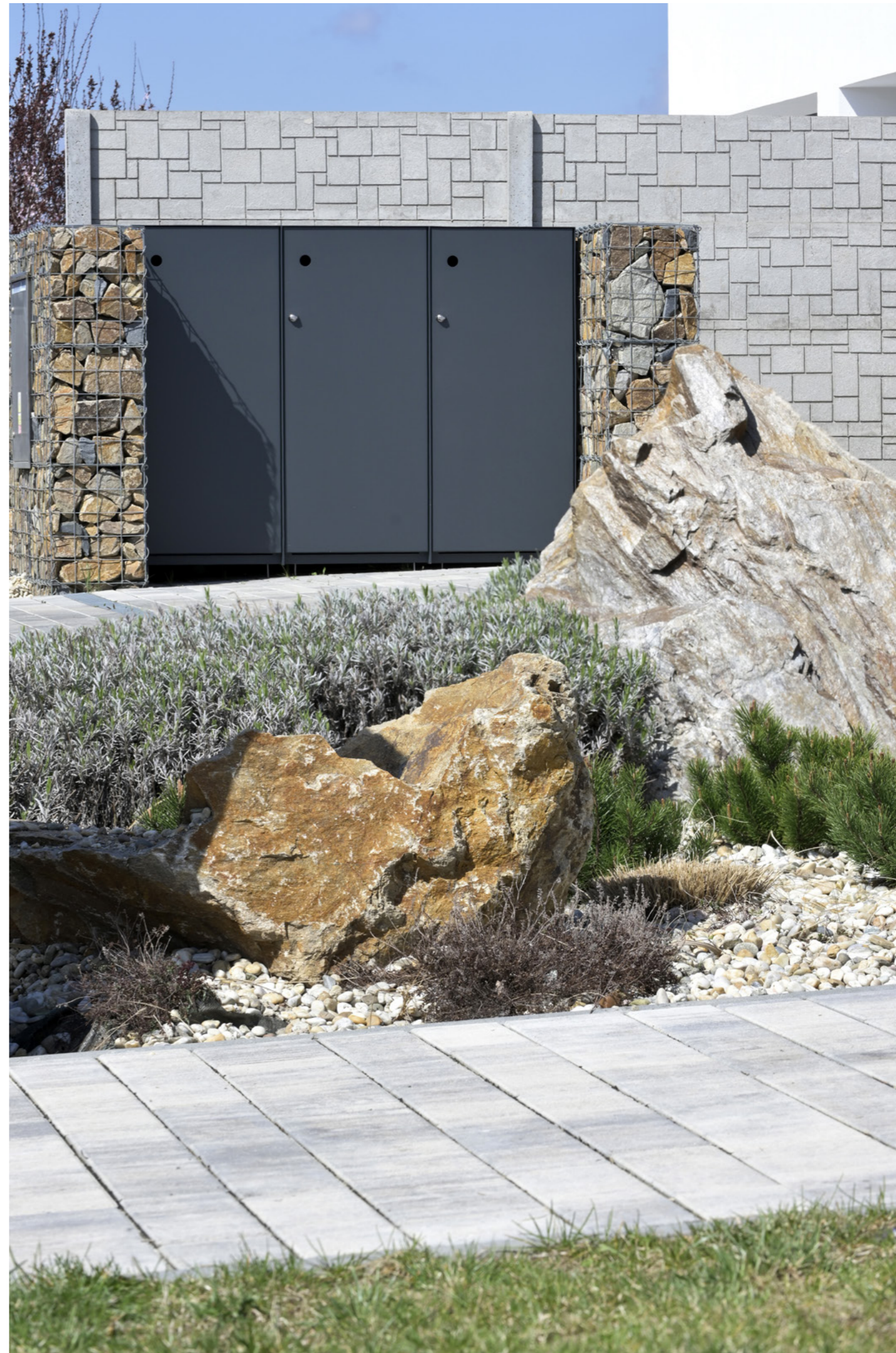
Vchodový systém Liberty, modul Messenger a Cleanny.