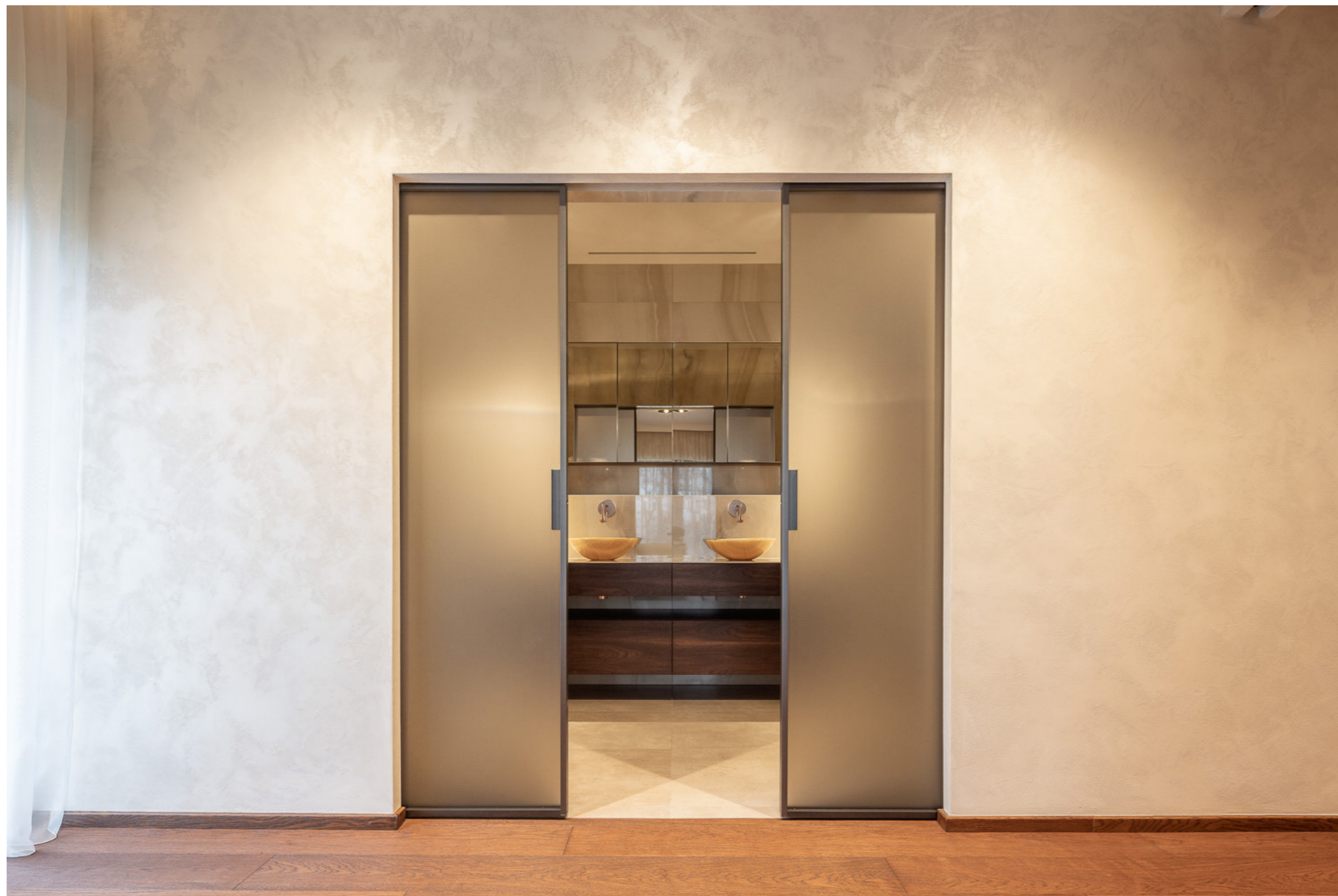
Dveře Idea, sklo satinato, madlo Ell, rám RAL 9005.