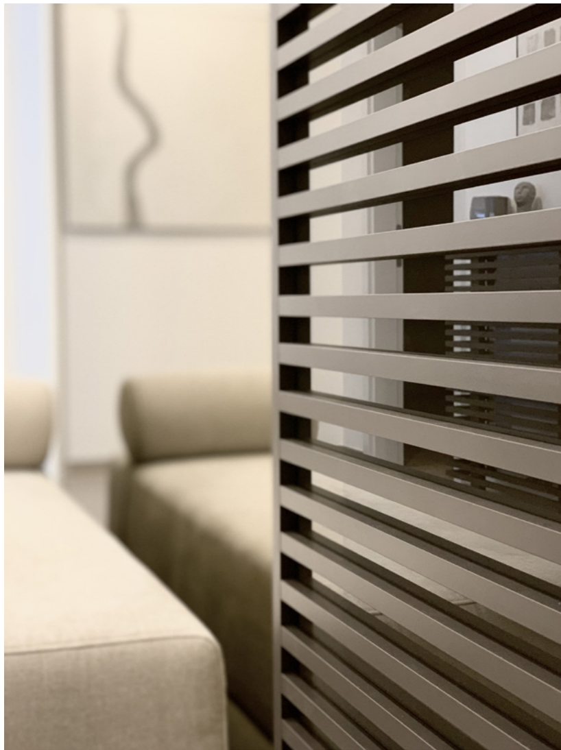
Dveře Idealine Horizontal, posuv Trix Trendy, madlo E11, rám RAL 7016.