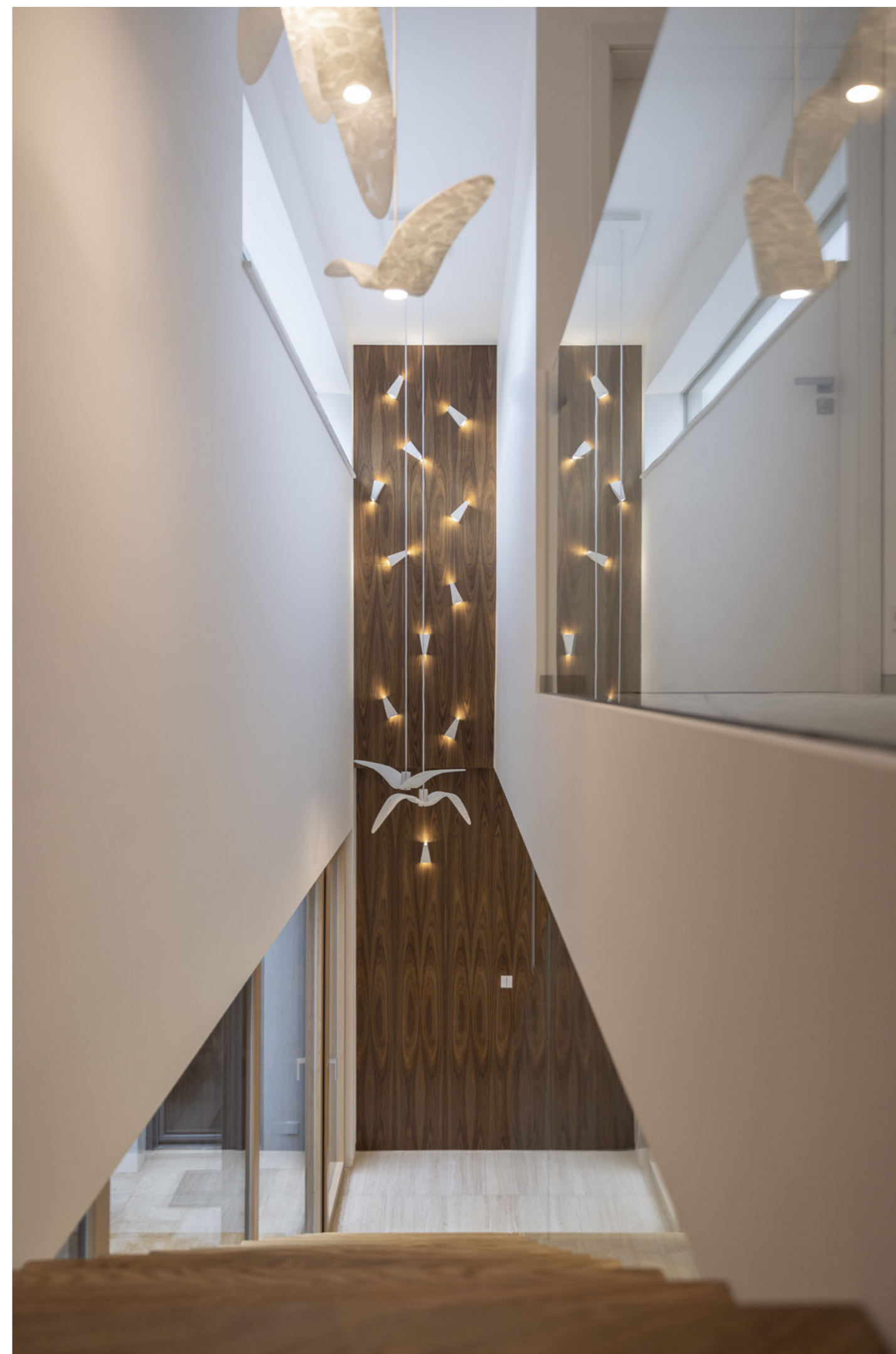
Master ajtó, Efekta ajtótok, Efekta burkolati rendszer, amerikai dió flóder furnér.

Tür Master, Zarge Efekta, Verkleidungssystem Efekta, Furnier Nussbaum amerikanisch Flader.