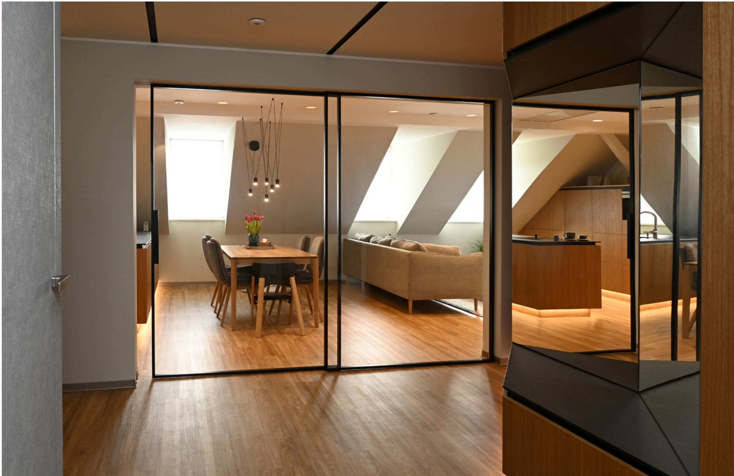
Dveře Idea, posuv Premium, sklo čiré, rám RAL 9005.