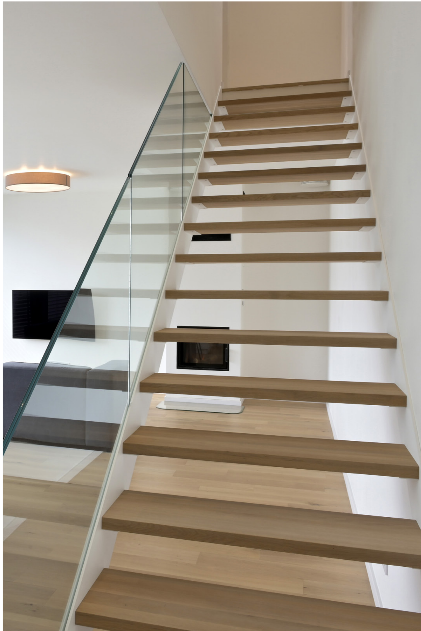
Schodíště Laser 1020, zábradlí Transparent.

„U tohoto projektu bylo třeba vycházet z prostorových regulativů daných zpracovanou územní studií, které využití pozemku plošně i objemově značně omezovaly.