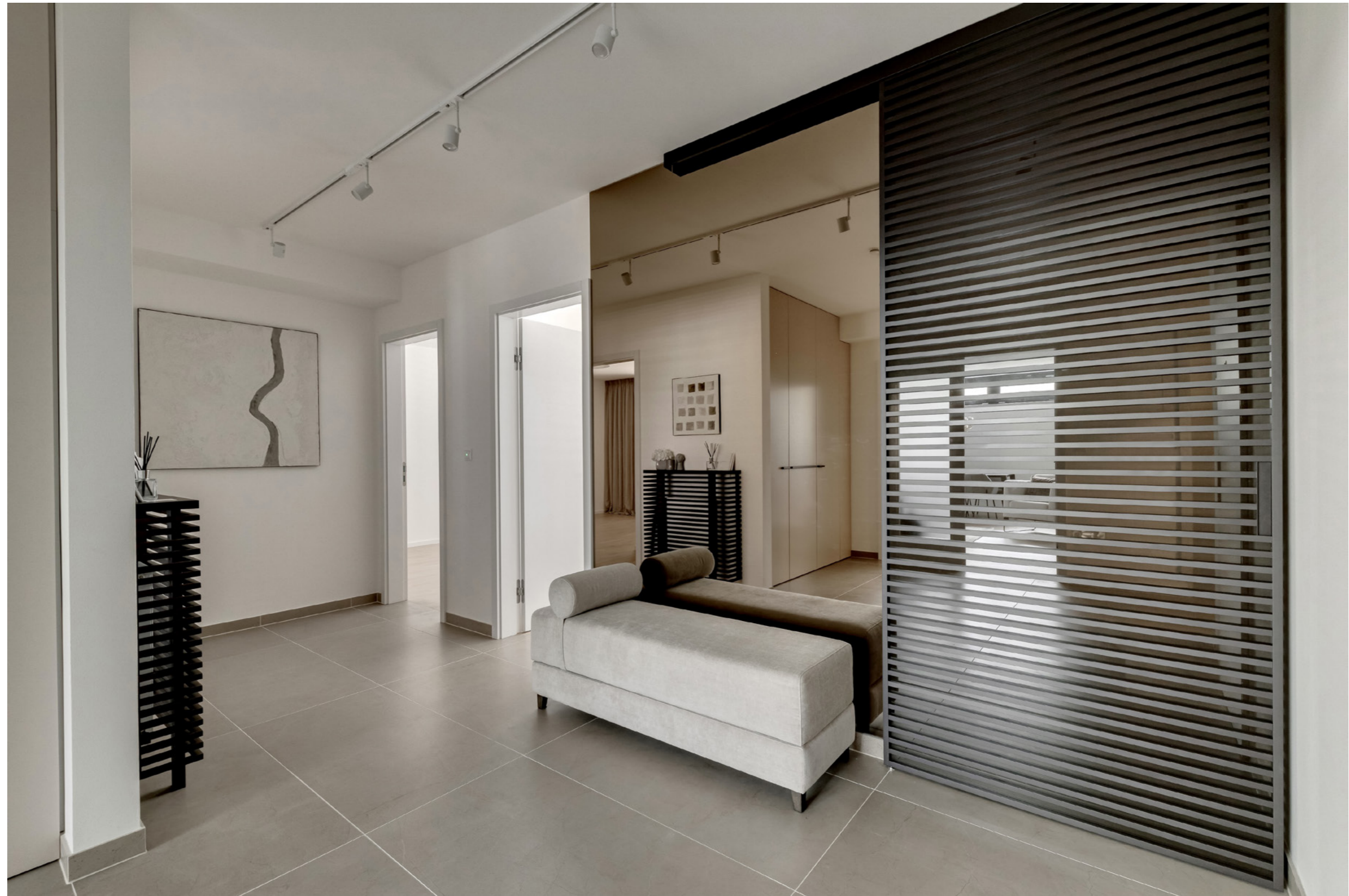
Idealine Horizontal door, Trix Trendy track, E11 handle, RAL 7016 frame.