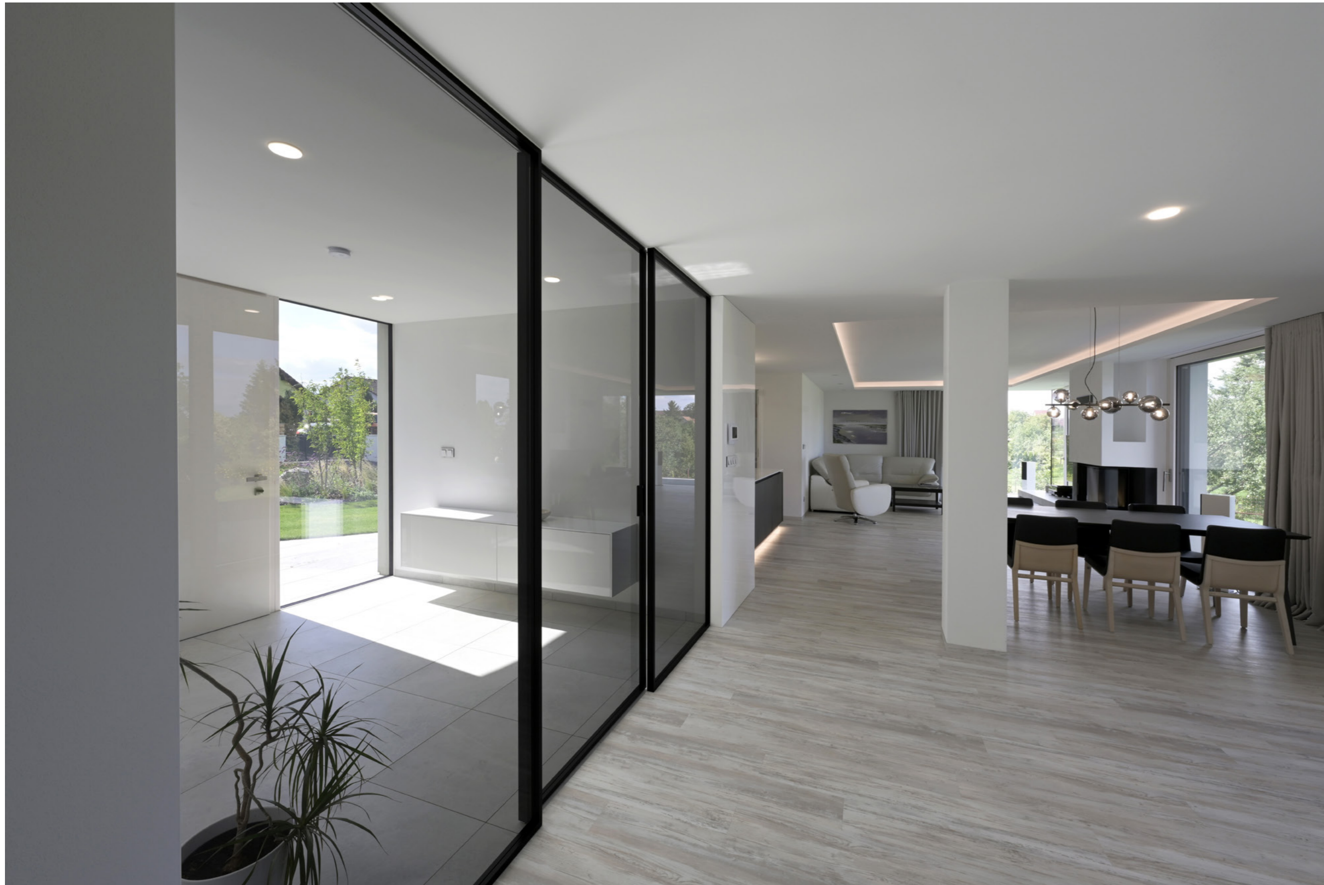
Dveře Idea, posuv Premium, sklo planibel šedý, madlo Eye, rám RAL 9005.