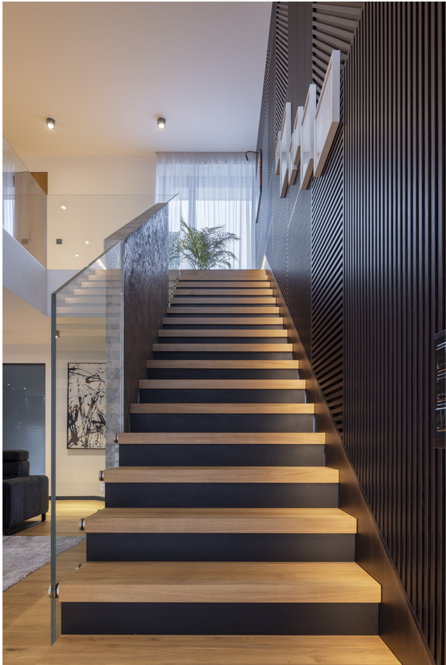
Schodíště Skelet, zábradlí Transparent.

„Práci na studii rodinného domu jsem převzala od projektanta, který navrhl základní koncept stavby. Studie prošla ještě výrazným vývojem a změnami dispozice i hmot. Již v této fázi navrhování jsem vše řešila i s ohledem na následnou tvorbu interiéru. Možnost navrhnout dům jako celek vytvořilo dobrý základ pro dotažení všech částí až k detailům.