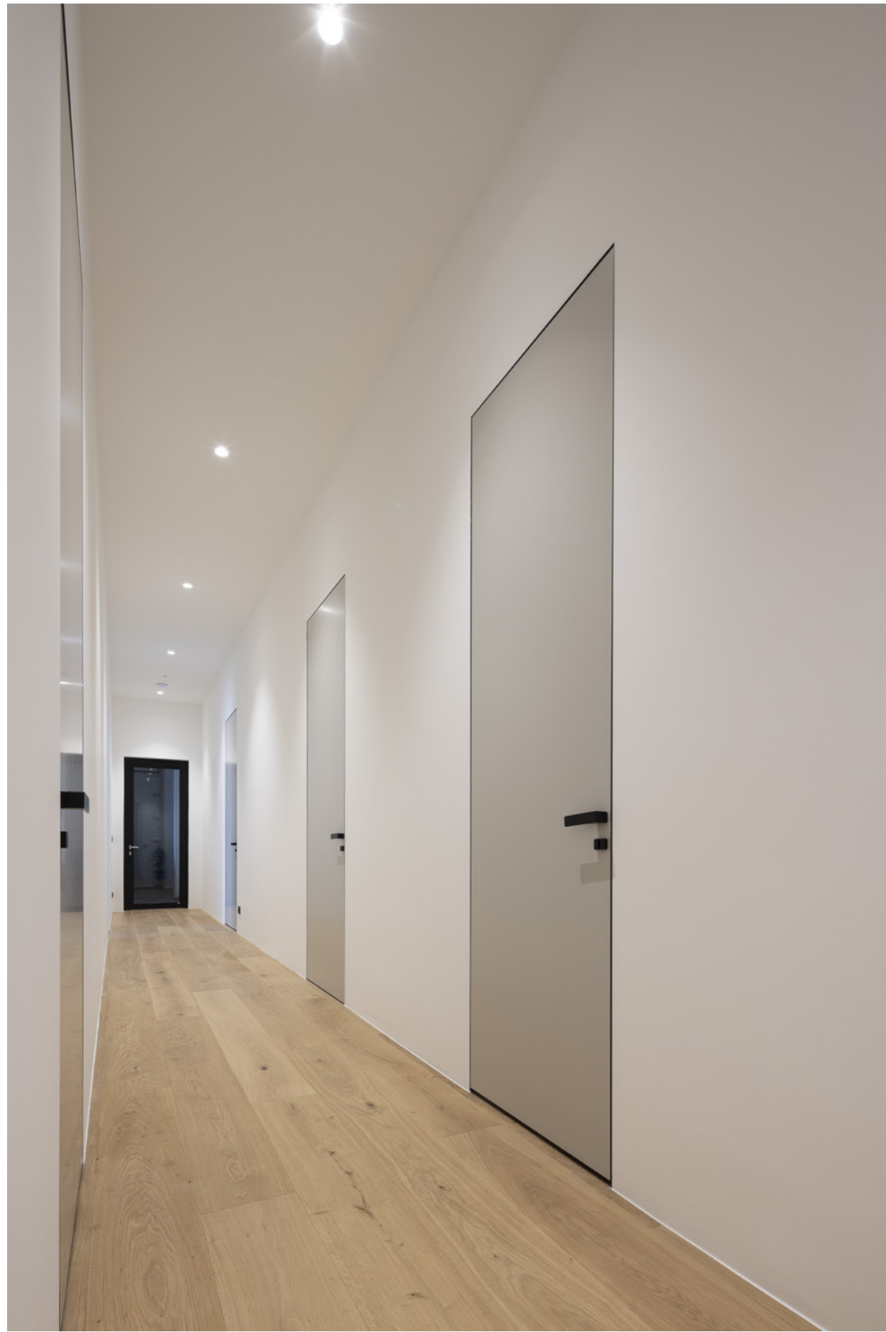
Dveře Master, zárubeň Aktive, rám RAL 9005.