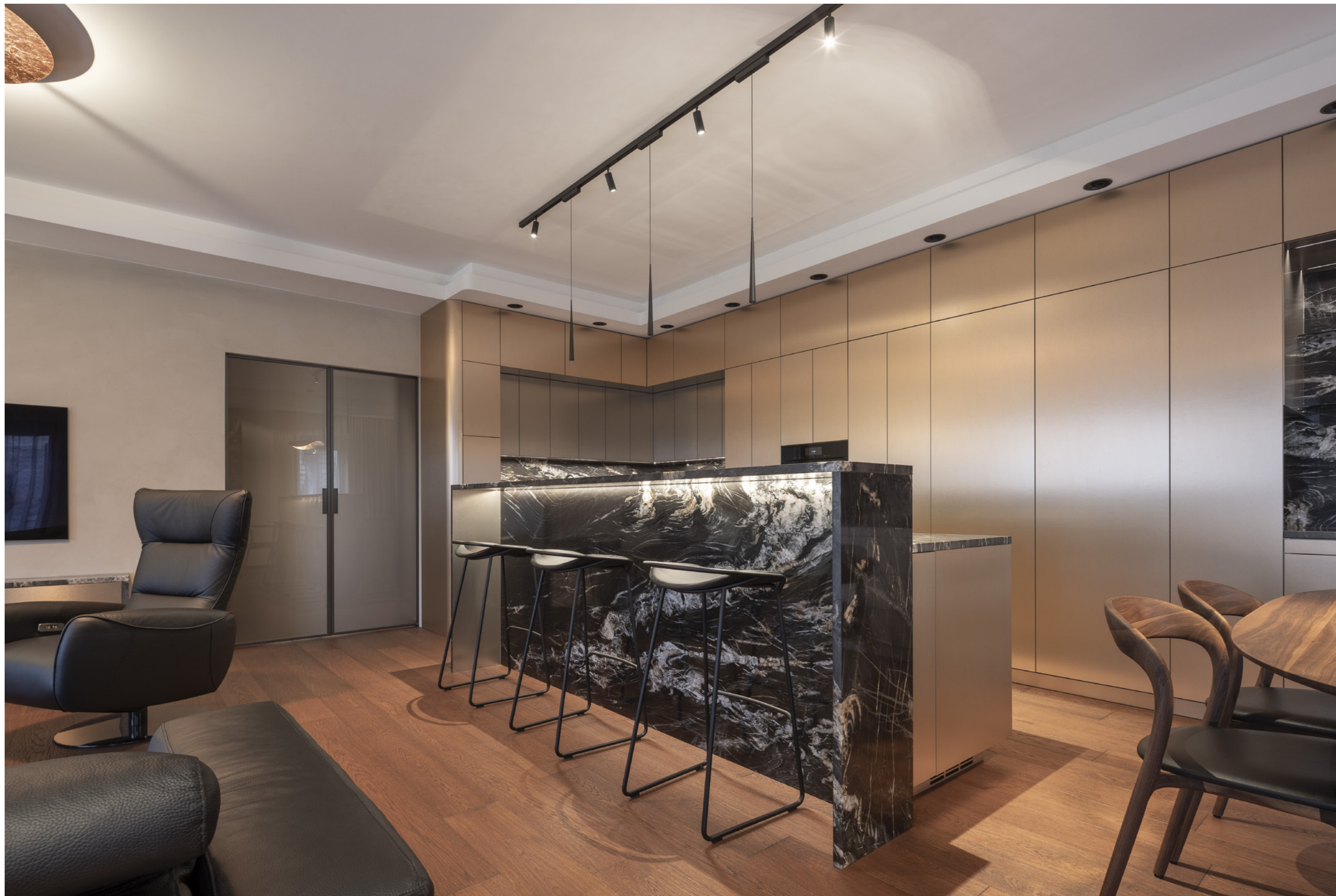
Dveře Idea, sklo satinato, madlo Ell, rám RAL 9005.