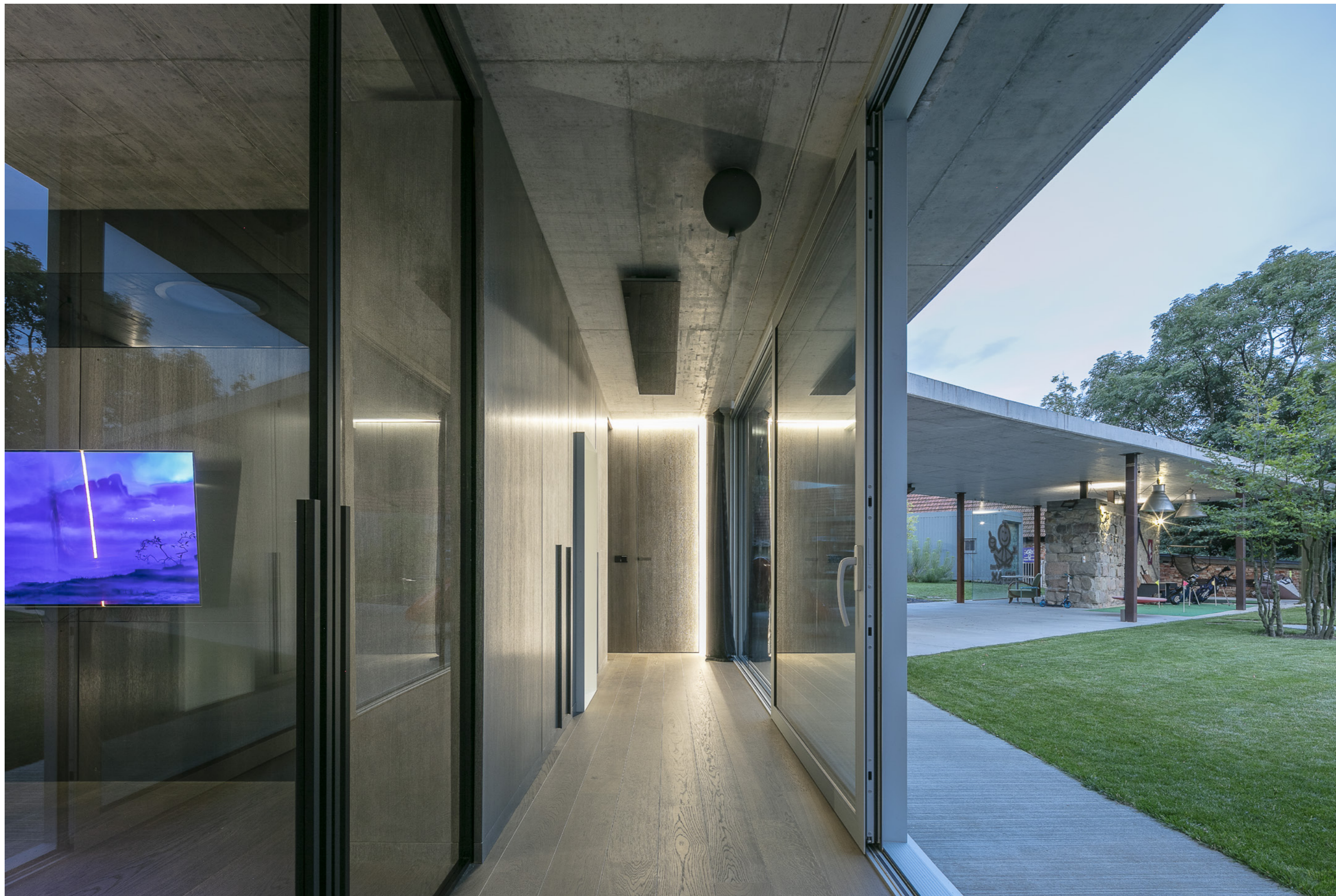
Dveře Idea, posuv Premium, sklo čiré, rám RAL 9005.