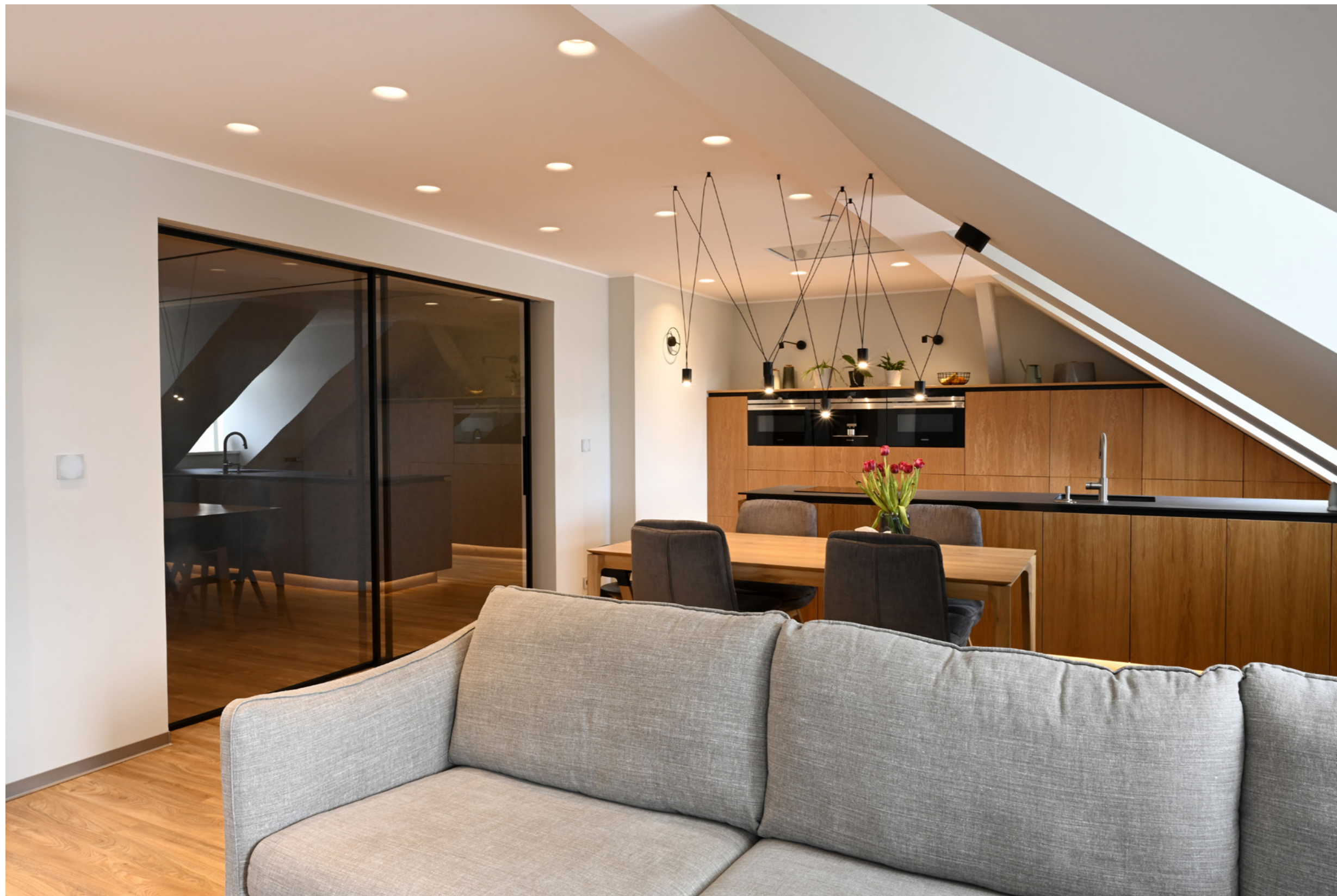
Dveře Idea, posuv Premium, sklo čiré, rám RAL 9005.