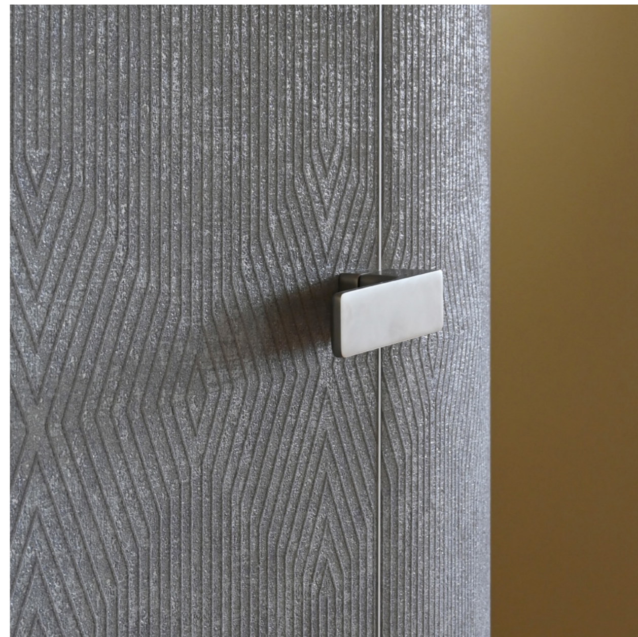
Tür Master mit Tapete, unsichtbare Zarge Aktive.