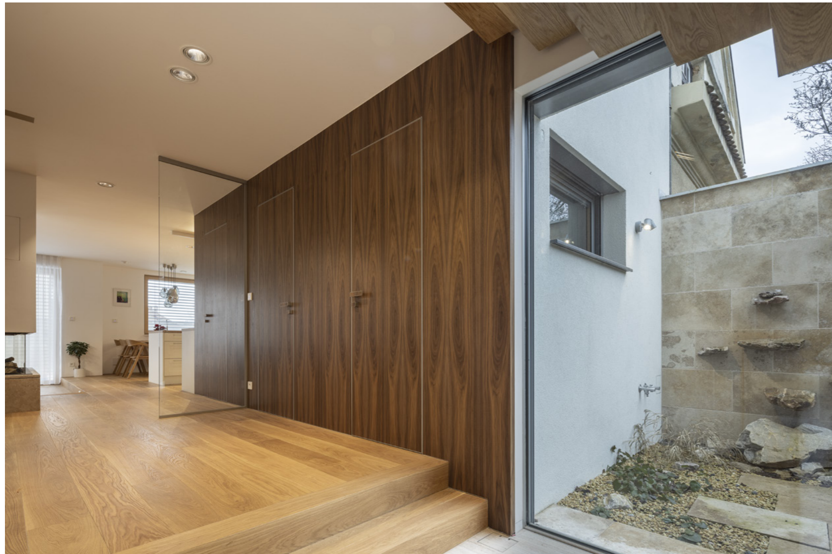
Dveře Master, zárubeň Efekta, obkladový systém Efekta, dřeva ořech americký flader.

Master door, Efekta door-frame, Efekta cladding system, American flader walnut veneer with cracks.