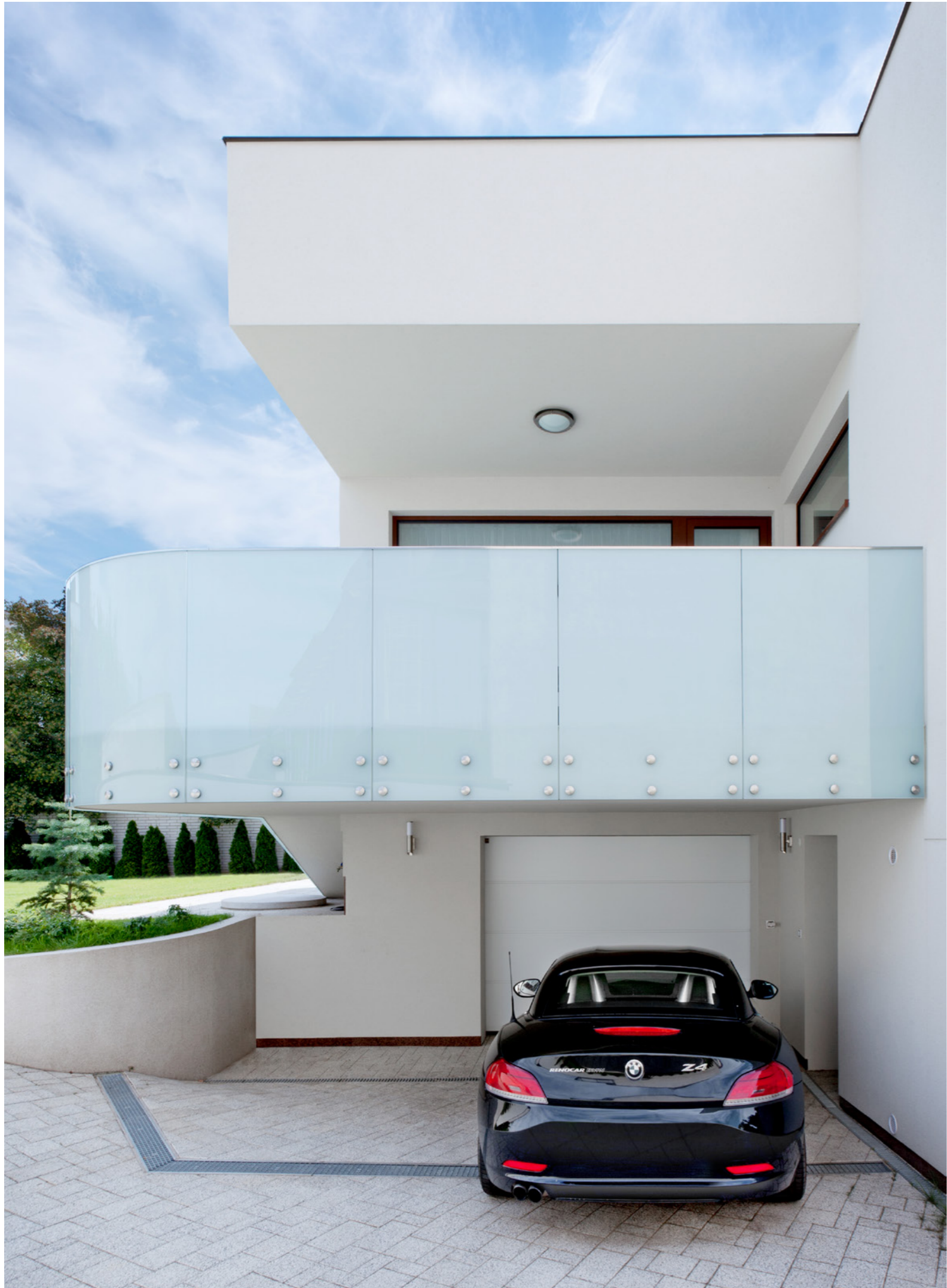
Zábradlí Transparent s mléčným sklem.

„Design je forma komunikace, při které nepotřebujete vyslovit ani slovo. Design jsou emoce. Touto cestou jsem šla i v případě realizace zábradlí luxusní vily v Hodoníně. Zábradlí vnímám nejen jako funkční konstrukční prvek, ale také jako výrazný estetický doplněk, v tomto případě v exteriéru. Celoskleněné zábradlí poskytlo nejen praktické a odolné řešení, ale dodalo domu lehkost, vzdušnost a estetický zážitek.“