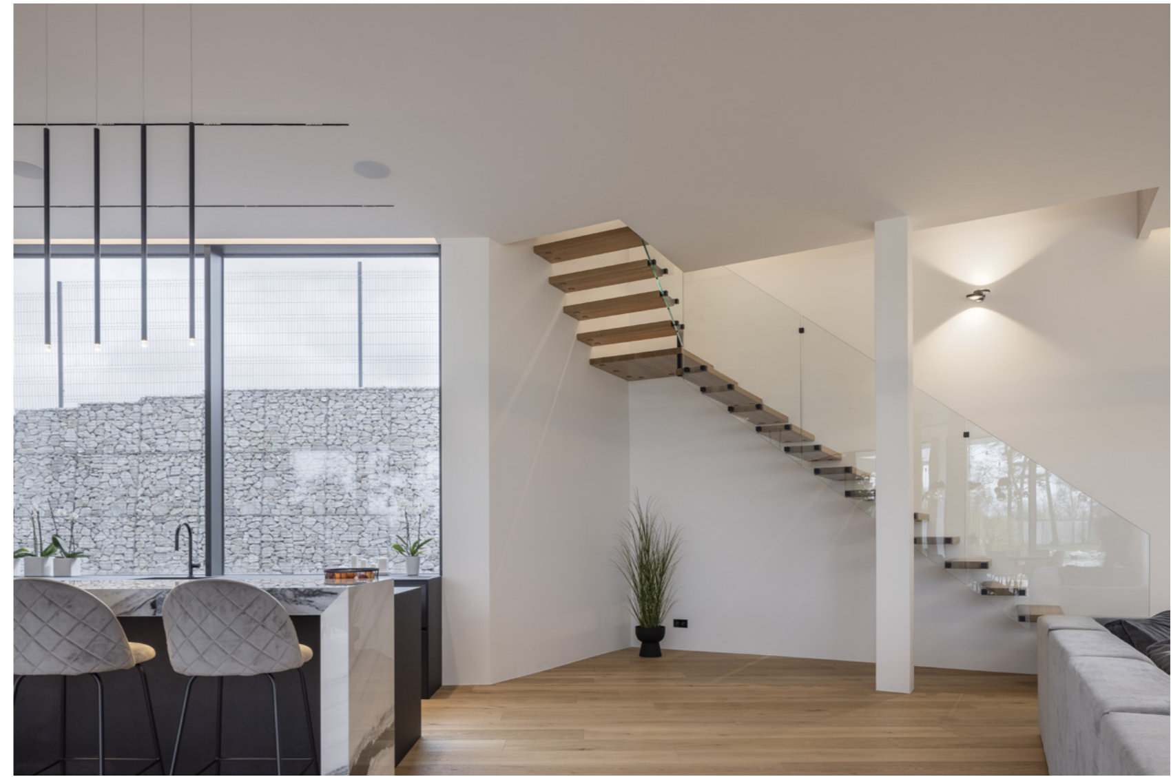
Schodiště Wing, zábradlí Transparent.