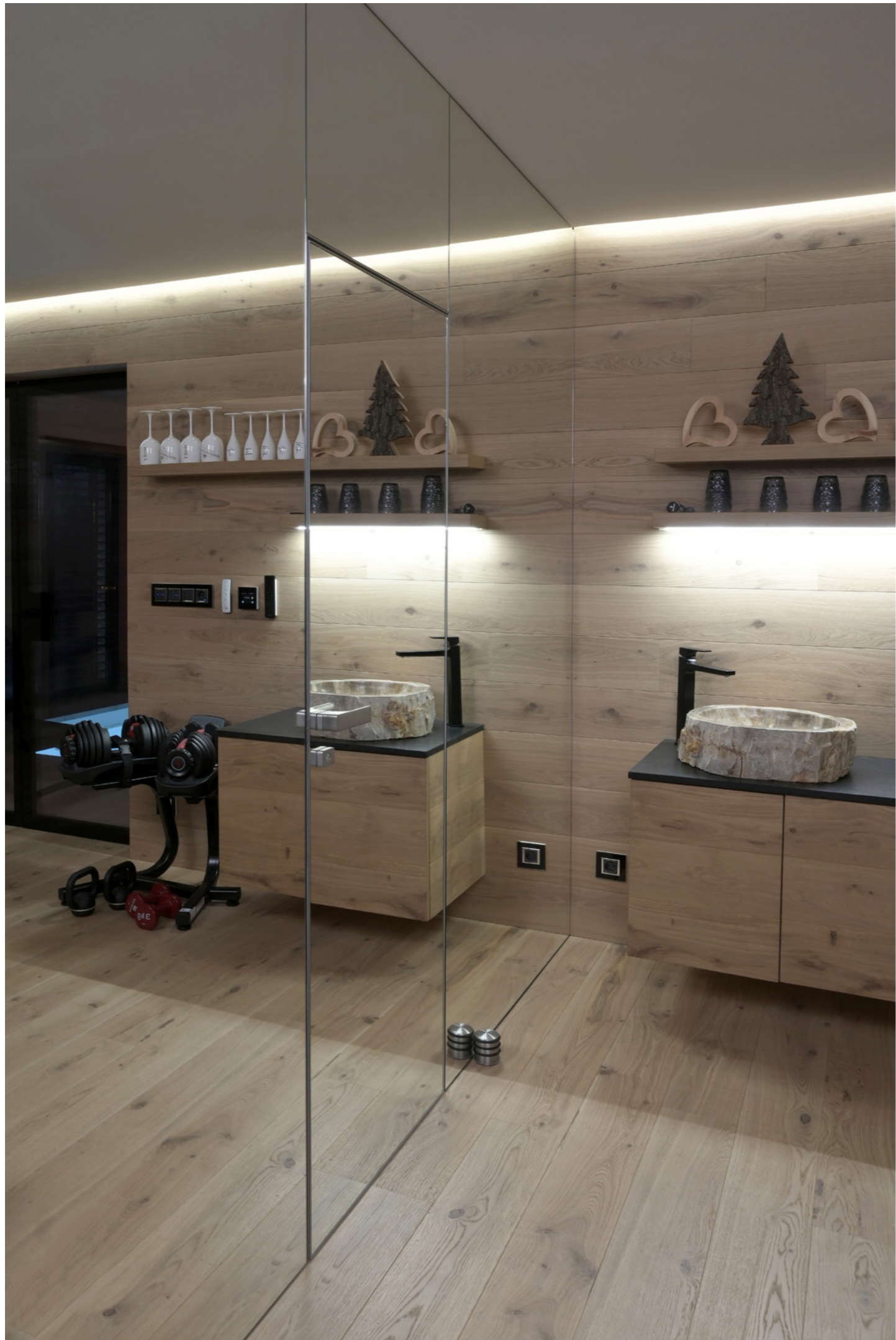
Dveře Master, zárubeň Efekta, zrcadlo.

„Potřebovali jsme vyřešit propojení bazénové haly s domácí fitness tak, aby bylo zajištěno odhlučnění a přitom byl zachován průhled oběma místnostmi. Podlahu zajistila firma Stilparkett. Pro ostatní produkty byla firma JAP naší první volbou. Měli jsme dobré zkušenosti z dřívějších realizací, takže nebyl žádný důvod hledat jiného dodavatele.“