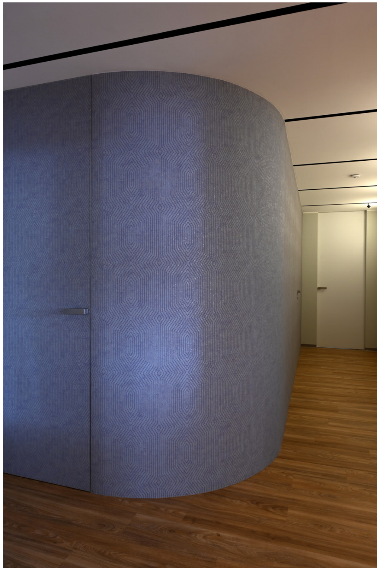
Master door with wallpaper, Aktive concealed doorframe.