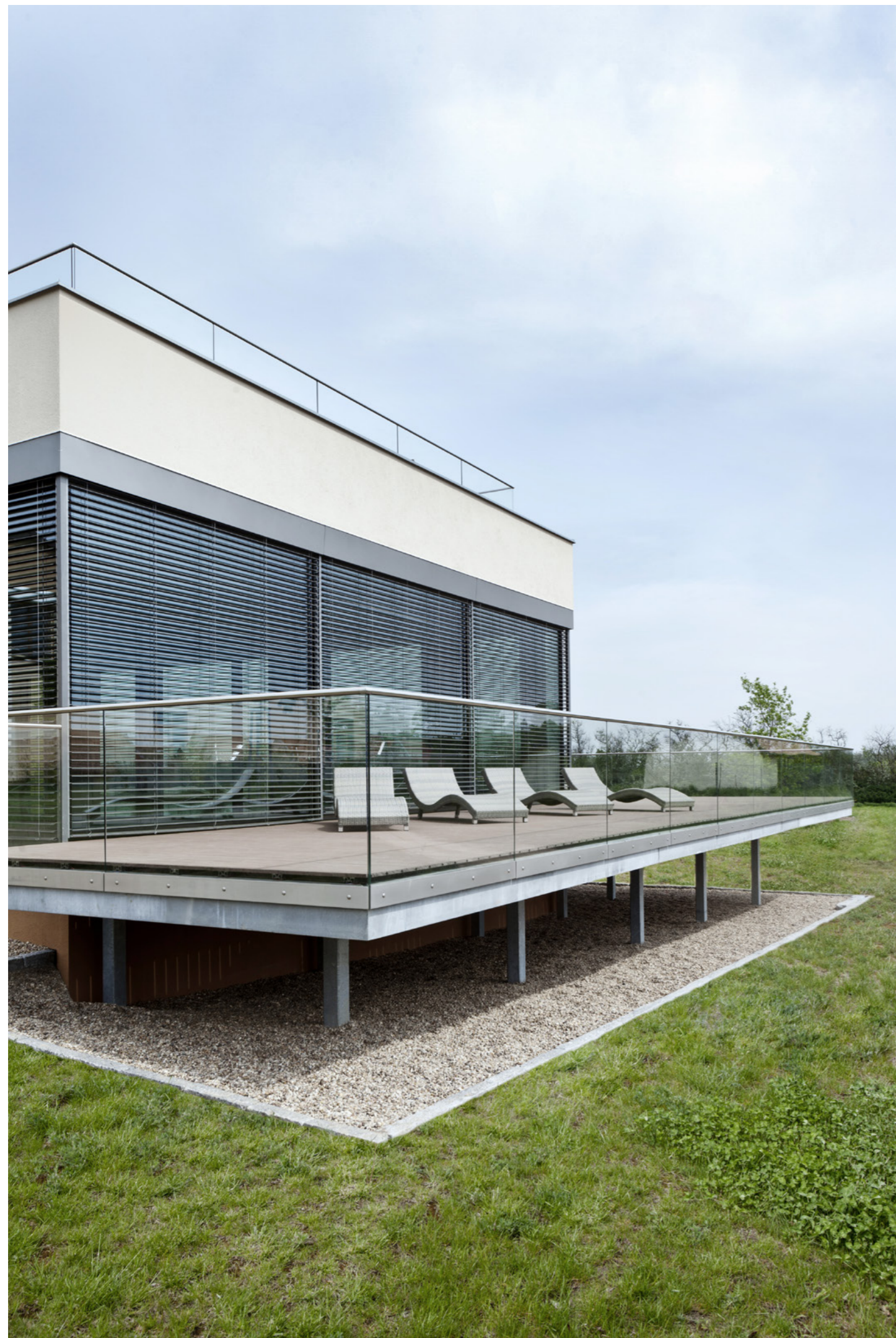
Balkónové zábradlí Axis.

„Náš projekt dostavby malého wellness centra hotelu Spa Resort Lednice vznikl pro potřeby částečného remodelingu investorova záměru a pro dokončení již rozestavěné hrubé stavby dle jiného projektu. Tuto výměnu na pozici odborného garanta a generálního projektanta zvládl náš ateliér velmi dobře, mj. zejména díky skvělému širokému realizačnímu týmu investora. Bylo nám ctí spolupracovat v takové společnosti. Jednou z klíčových firem byla i firma JAP, která dodávala designové sklářské výrobky v interiéru i exteriéru.“