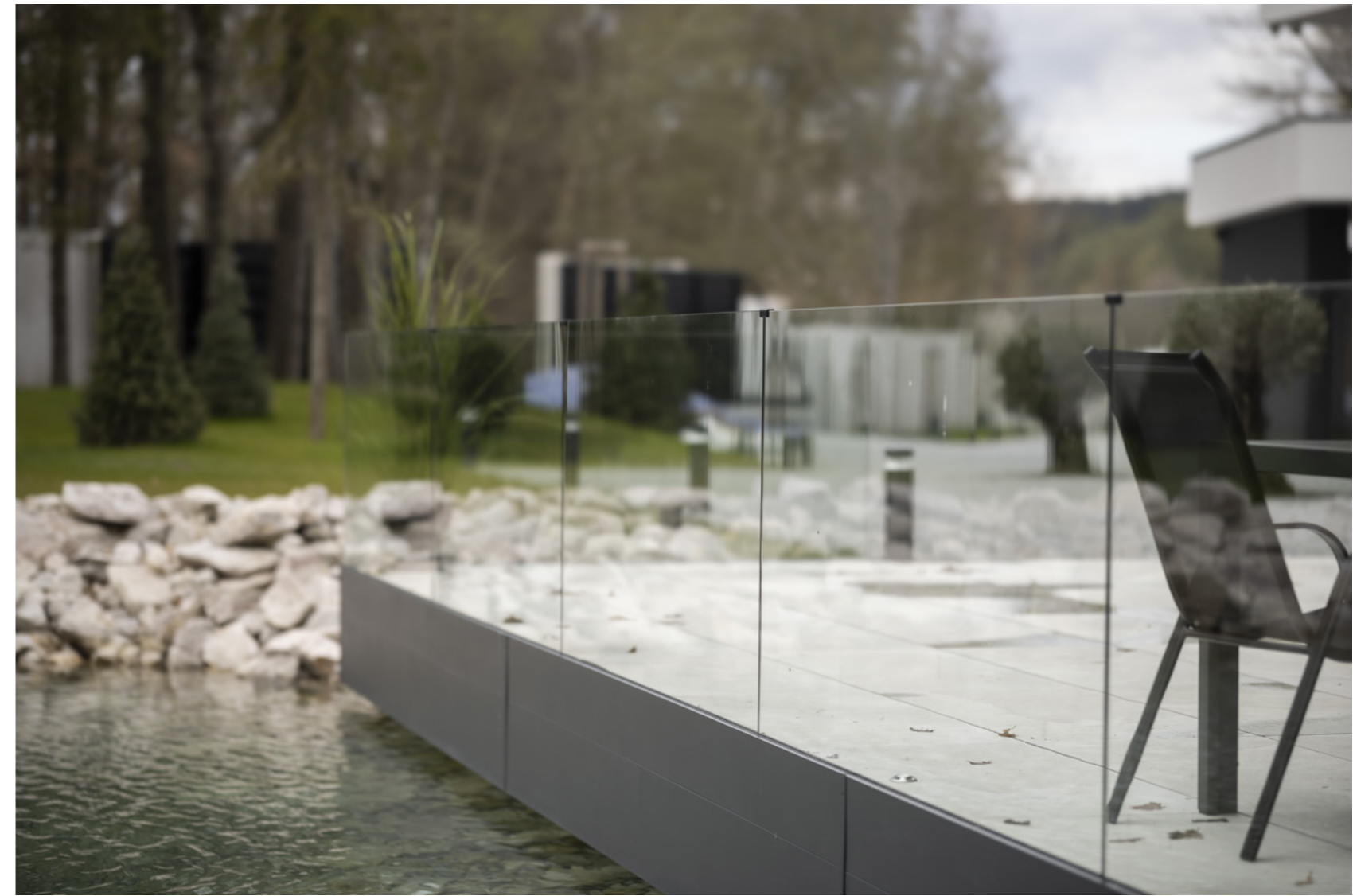
Balkónové zábradlí Consul.