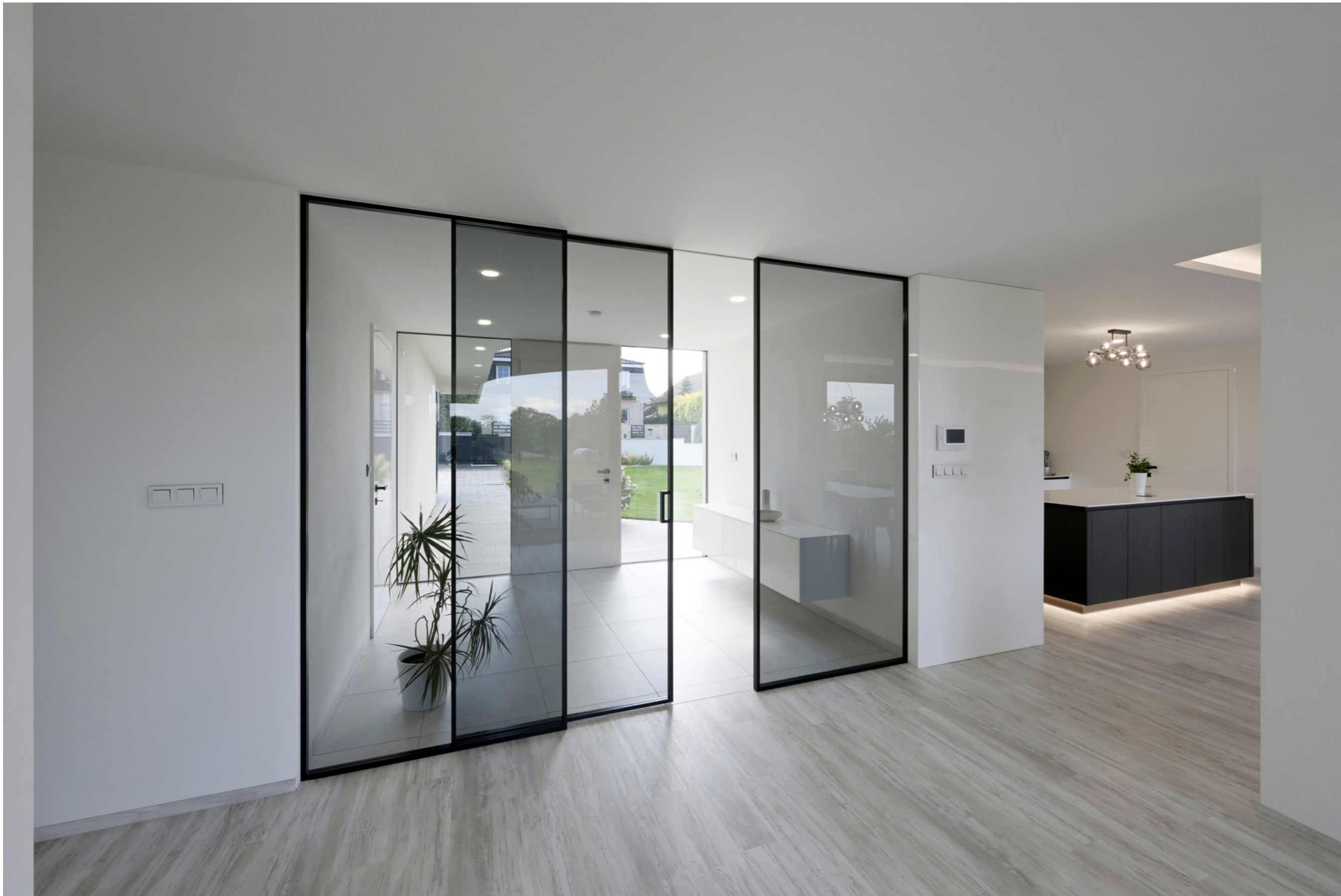
Dveře Idea, posuv Premium, sklo planibel šedý, madlo Eye, rám RAL 9005.