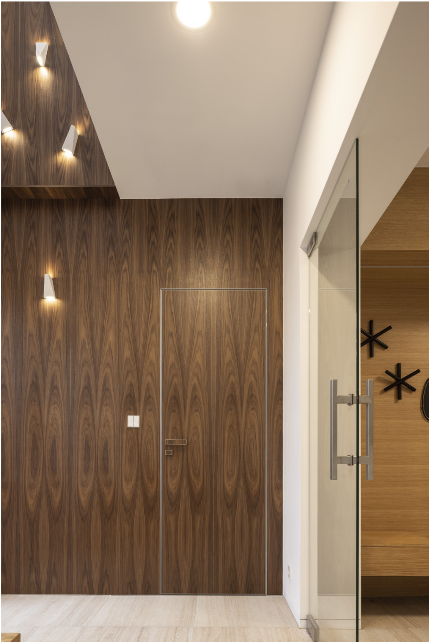
Dveře Master, zárubeň Efekta, obkladový systém Efekta, dýha ořech americký flader.

„Ideou realizace interiéru byl plynulý přechod ze schodišťové haly do hlavního obytného prostoru tak, aby se dané prostory vzájemně přirozeně prolínaly. Zároveň tato kontinuita měla probíhat vertikálně i do druhého nadzemního podlaží, což se podařilo vyřešit stěnou v dřevěném obkladu. Důležitý je kontrast použitých materiálů, čistota skrytých dveří v obkladu a přirozené světlo z patia rodinného domu.